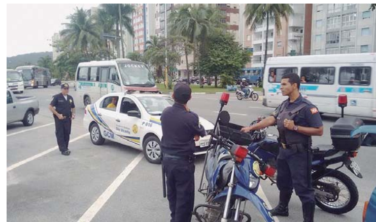
A Guarda Municipal preparada para atuar em várias frentes

Reforço – São Vicente recebeu ontem, quarta-feira (27), reforço de 37 novos policiais militares. Lotados no 39º Batalhão de Polícia Militar do Interior João Ramalho . Esses policiais que em período de estágio fizeram policiamento a pé, na área comercial, serão redistribuídos no rádio patrulhamento,