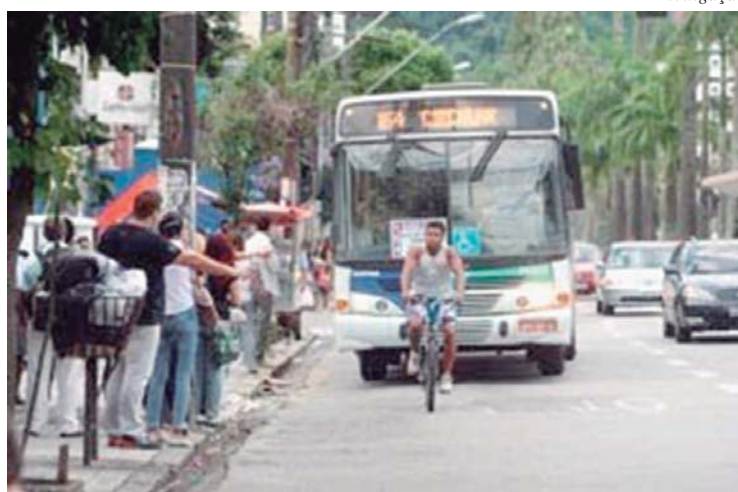
A CET ignora o grande número de idosos que usa o transporte coletivo

O remanejamento do ponto próximo ao Pronto Atendimento da Unimed onde funciona também uma unidade de fisio-