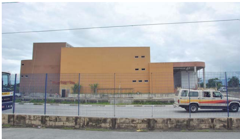
Obra parada desde 2011 será investigada pela Câmara